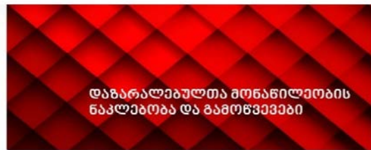
სისხლის სამართლის საერთაშორისო სასამართლოს გამოძიება - საქართველოს სიტუაცია