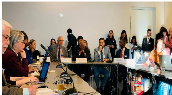
ICC პროკურორი საქართველოს სიტუაციაზე

ომის დროს მომხდარ დანაშაულებს ჰააგის სასამართლოს პროკურორის ოფისი 2016 წლის იანვრიდან იძიებს. მიუხედავად იმისა, რომ გამოძიების დაწყებიდან 4 წელზე მეტი გავიდა, დღემდე არ მომხდარა 2008 წლის ომის დროს ჩადენილი დანაშაულების ეფექტიანი გამოძიება და დამნაშავე პირთა დასჯა . აღნიშნული დანაშაულების სათანადოდ გამოძიება და პასუხისმგებელ პირთა გამოვლენა ეროვნულ დონეზე მიმდინარე გამოძიების ფარგლებშიც არ მომხდარა .